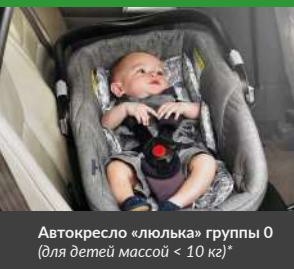
Автокресло «люлька» группы 0 (для детей массой < 10 кг)*

При покупке детского удерживающего устройства обязательно следует уточнить у продавца наличие сертификата на товар!