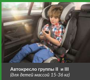
Автокресло группы II и III (для детей массой 15-36 кг)