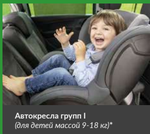
Автокресла групп I (для детей массой 9-18 кг)*