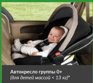
Автокресло группы 0+ (для детей массой < 13 кг)*