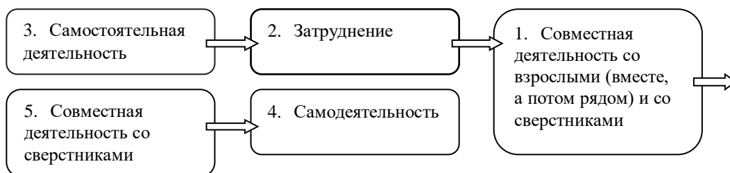
Схема развития любого вида деятельности у детей

Оптимальные условия для развития ребенка – это продуманное соотношение свободной, регламентируемой и нерегламентированной (совместная деятельность педагогов и детей и самостоятельная деятельность детей) форм деятельности ребенка. Образовательная деятельность вне организованных занятий обеспечивает максимальный учет особенностей и возможностей ребенка, его интересы и склонности. В течение дня во всех возрастных группах предусмотрен определенный баланс различных видов деятельности: